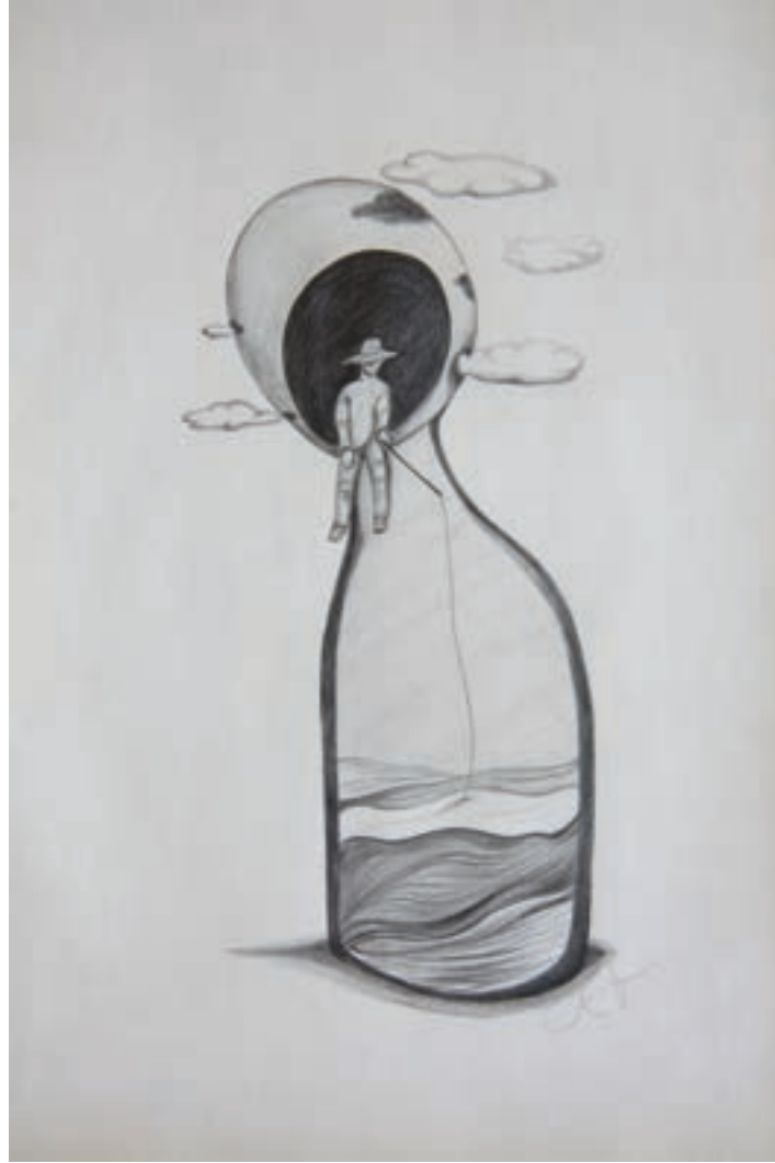
Yalnızlık / Loneliness Karakalem-Drawing-(Eskiz-Sketch)-2017-29,7x42cm