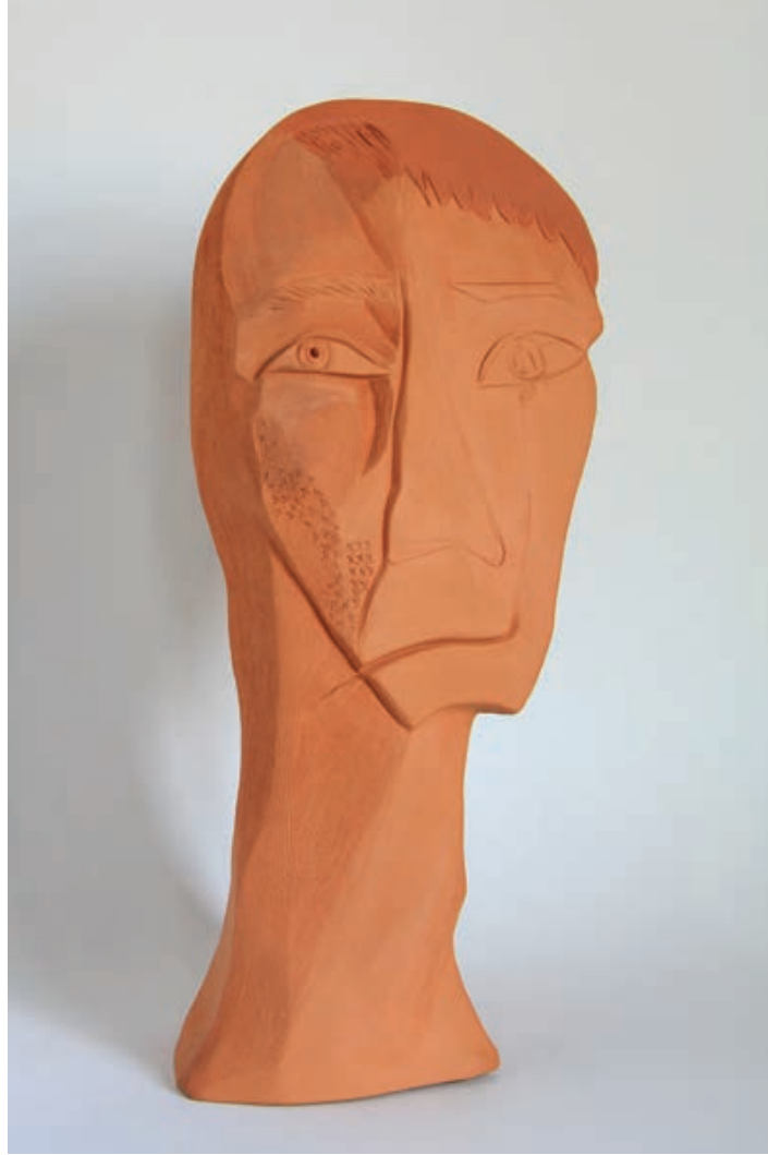
Savaş ve Göz Yaşı / War and Tear Kırmızı Kil-Red Clay-(Seramik Heykel-Ceramic Sculpture)-2017- 39x19x19cm