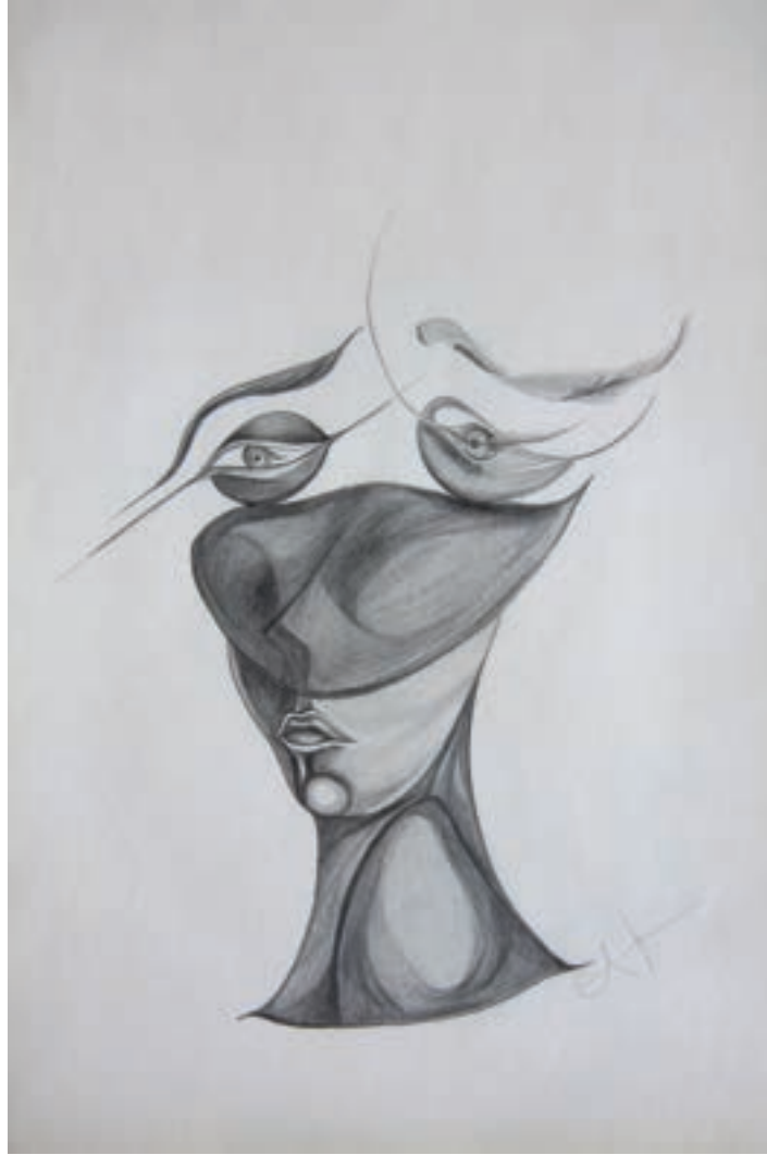
Aşk ve Gözler / Love and Eyes Karakalem-Drawing (Eskiz-Sketch)-2017-29,7x42cm