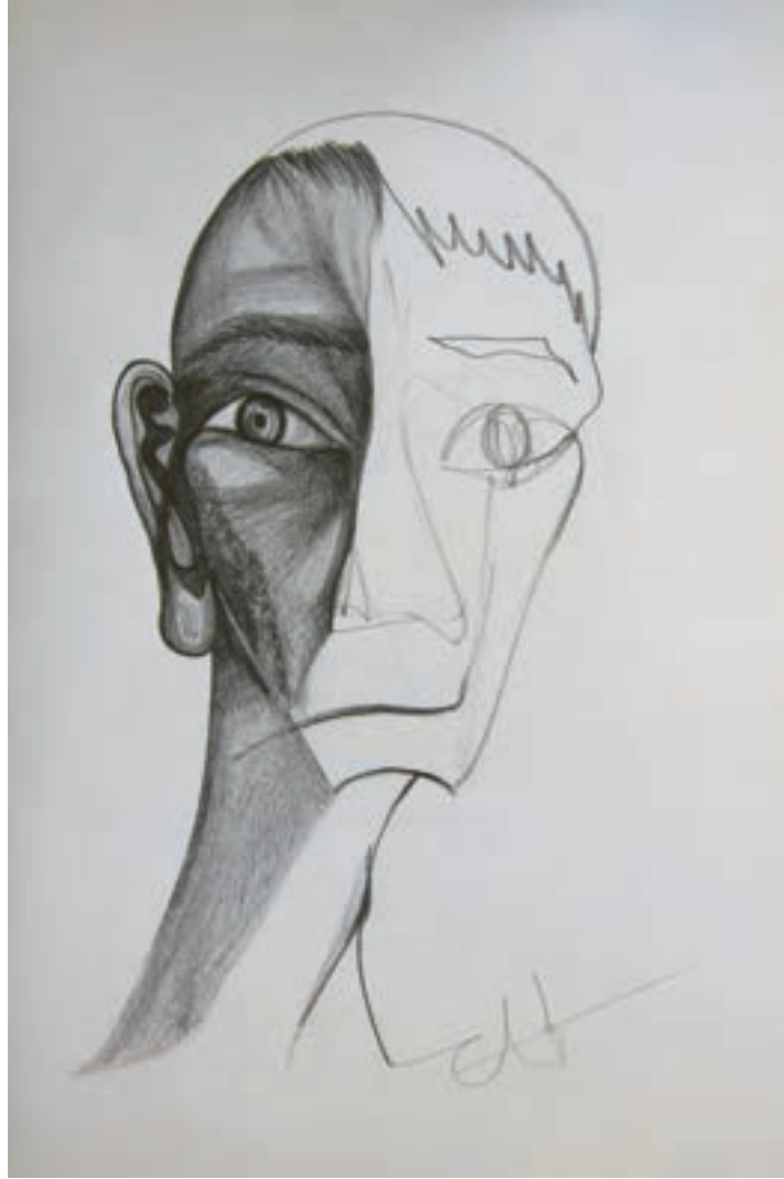
Savaş ve Göz Yaşı / War and Tear Karakalem-Drawing(Eskiz-Sketch)-2017-29,7x42cm