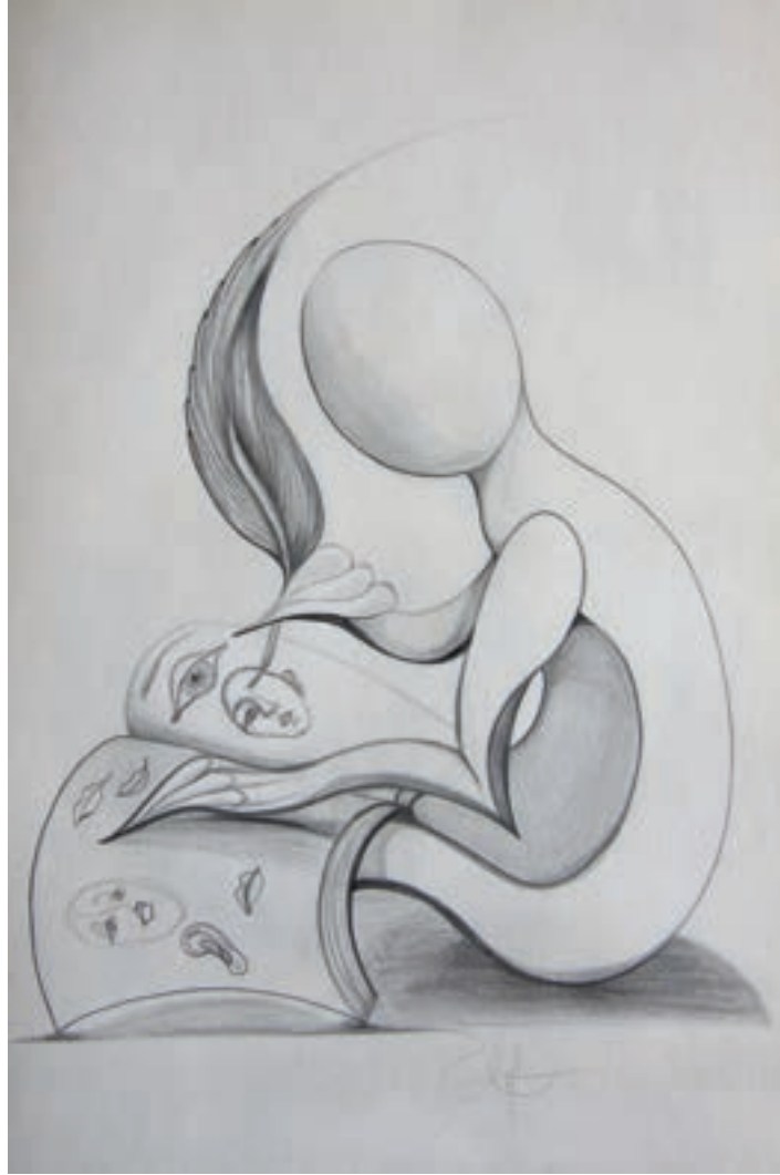
Kendin Ol / Be Yourself Karakalem, Drawing (Eskiz-Sketch)-2017-29,7x42cm