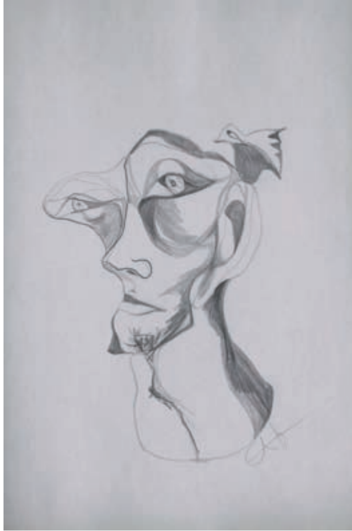
Gururlu ve Yumuşak Kalpli / Proud and Softhearted Karakalem-Drawing-(Eskiz-Sketch)-2017-29,7x42cm