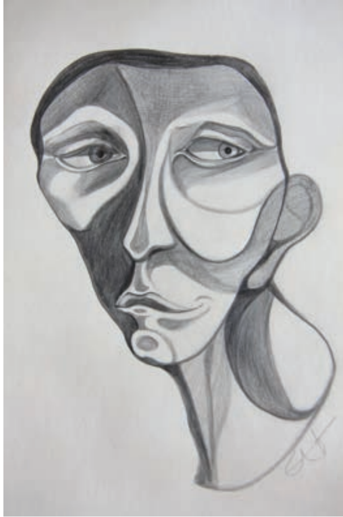
Gözetlemek / Peeking Karakalem-Drawing(Eskiz-Sketch)-2017-29,7x42cm