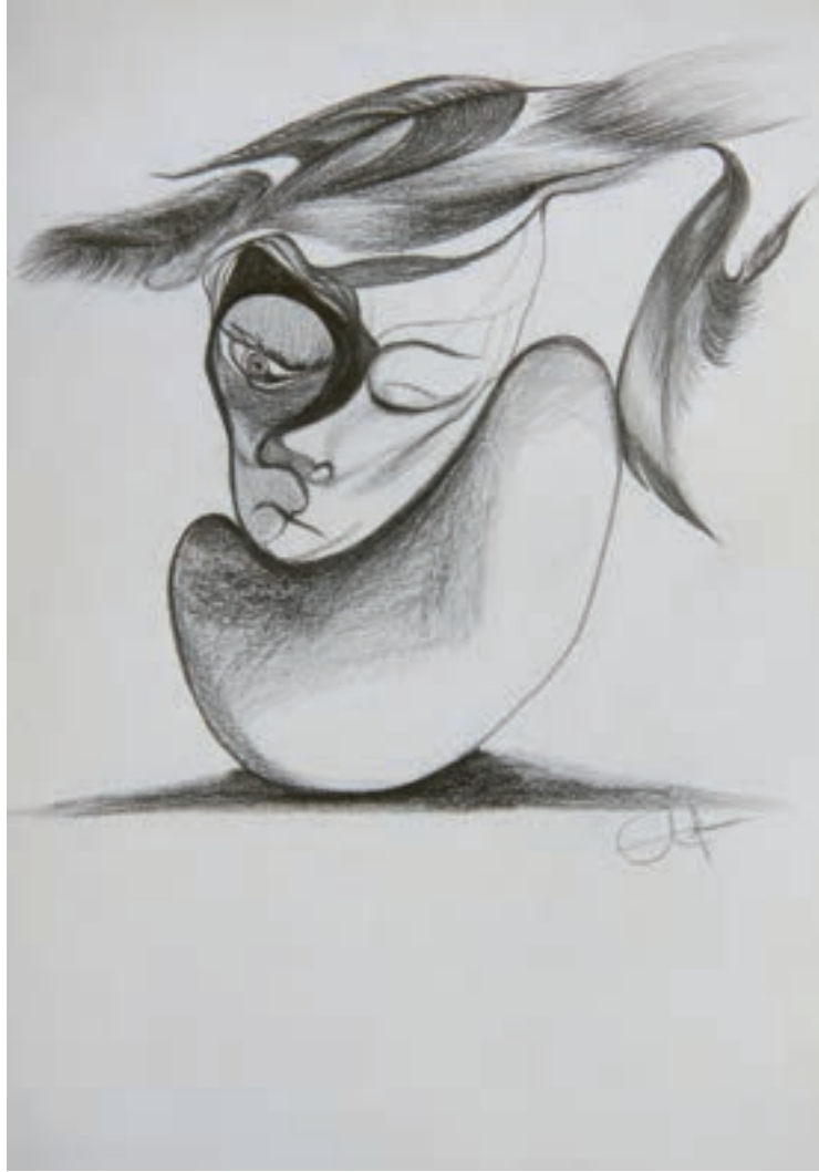
Uykusuzluk ve Uykulu / Insomnia and Sleepy Karakalem-Drawing-(Eskiz-Sketch)-2017-21x29,7cm