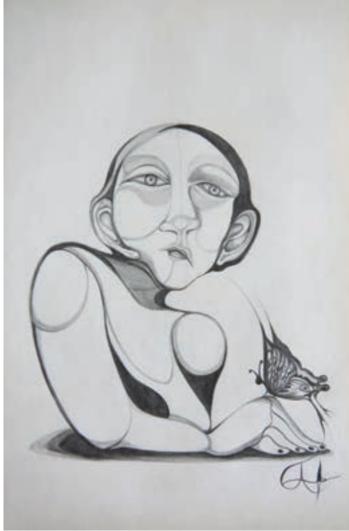
Kusursuz Duruş-Perfect Posture Karakalem-Drawing-(Eskiz-Sketch)-2017-29,7x42cm