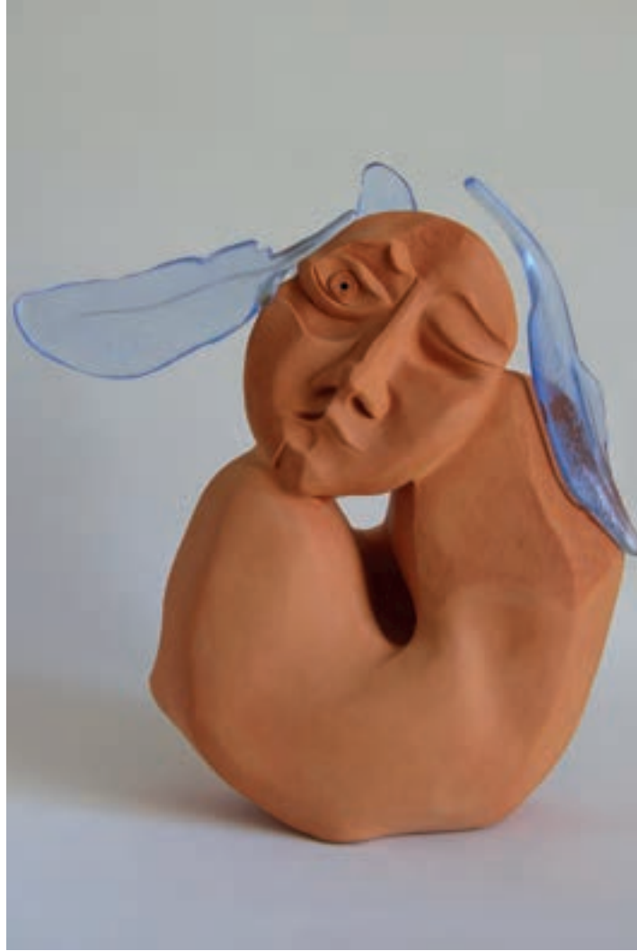
Uykusuzluk ve Uykulu / Insomnia and Sleepy Kirmızı Kil ve Cam-Red Clay and Glass-(Seramik Cam Heykel-Ceramic Glass Sculpture)-2017-36x36x14cm