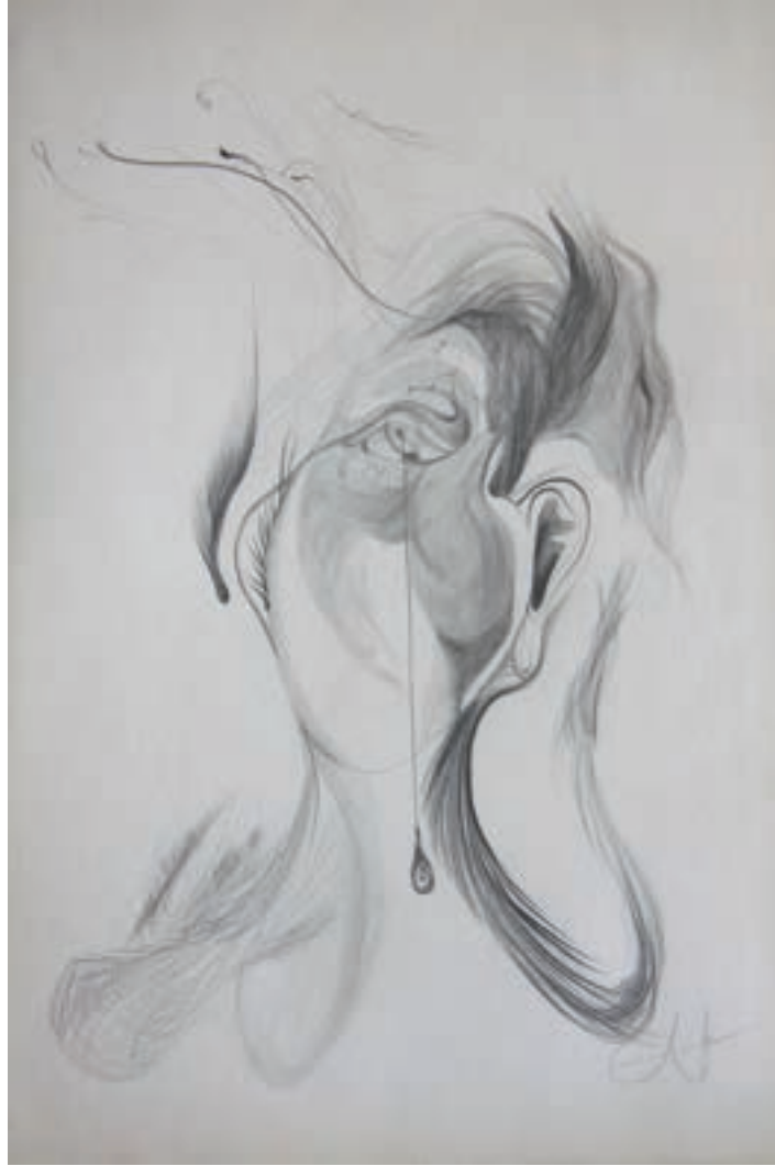
Sarkaç Gözyaşı-Tear of Pendulum Karakalem-Drawing(Eskiz-Sketch)-2017-29,7x42cm