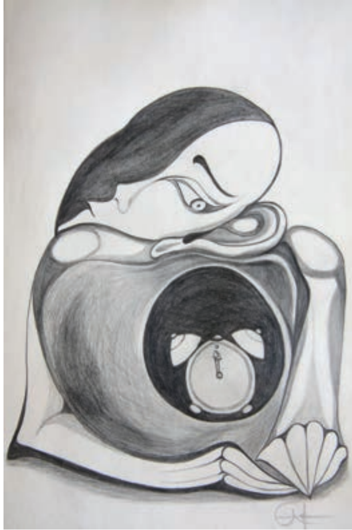
Kader / Destiny Karakalem-Drawing(Eskiz-Sketch)-2017-29,7x42cm